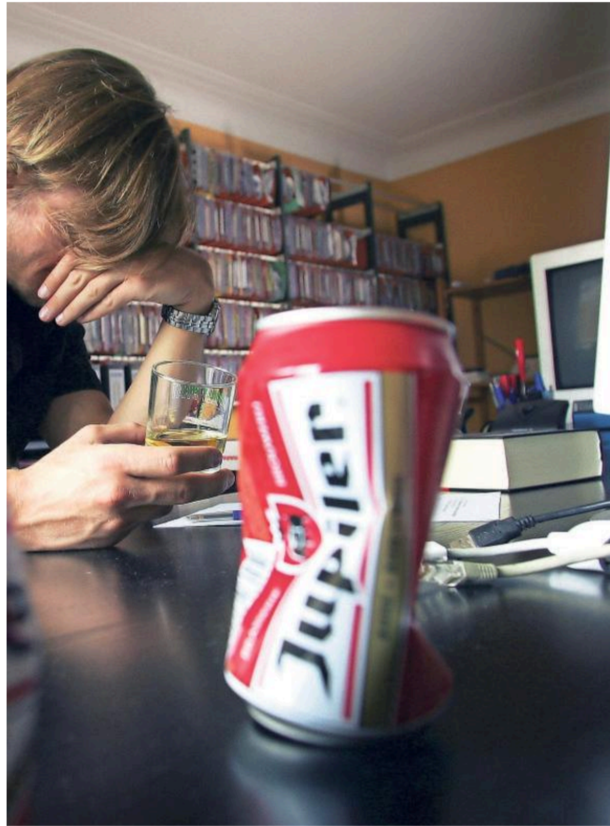
Wie tobend thuiszit grijpt snel naar drank, drugs en ongezonde snacks.

Soms zitten patiënten klem. Zoals een 34-jarige vader van drie kinderen. „Hij heeft een nare lachgasverslaving. Hij is alles kwijt, woont weer bij zijn ouders en die